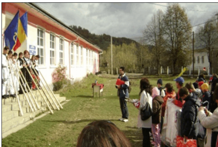
Fig. 10. Școala generală „Avram Iancu”

În 1995 s-a schimbat denumirea școlii în Școala Generală “Avram Iancu” cu ocazia împlinirii a 171 ani de la nașterea marelui erou, ocazie cu care a fost dezelită și o placă comemorativă.