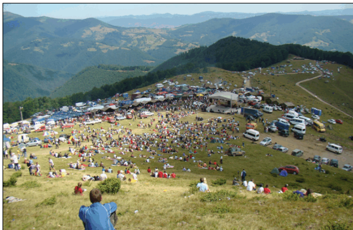
Fig. 8. Târgul de fete de pe Muntele Găina

Fondul turistic este bogat. Astfel, fondul turistic social-cultural-istoric este bine evidențiat: Biserica Ortodoxă , ctitorie de la 1792, Casa memorială "Avram Iancu" care găzduiește și o expoziție etnografică, colecția muzeală a Scolii Generale "Avram Iancu", meșteri văsari făuritori de tulnice, formația de tulnicărese și " Târgul de fete " de pe Muntele Găina (fig. 8).