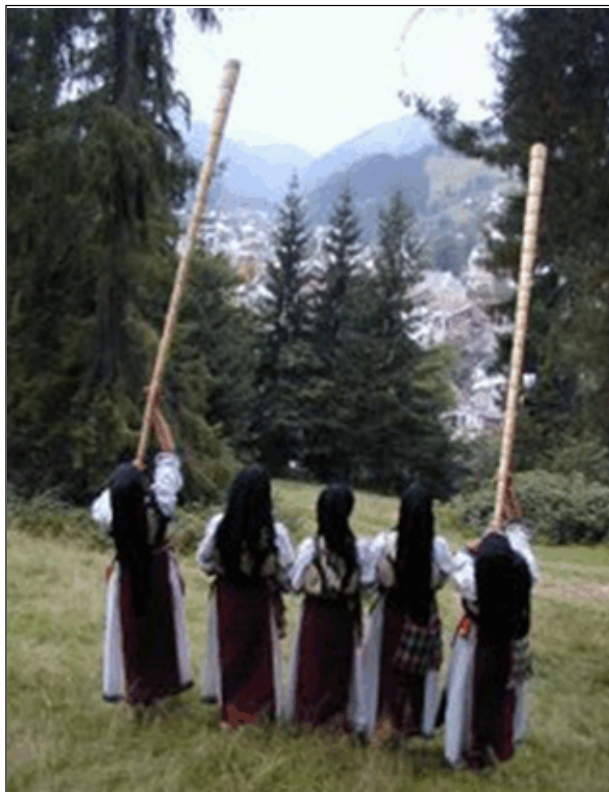
Fig. 9. Tulnicăresele din comuna Avram Iancu