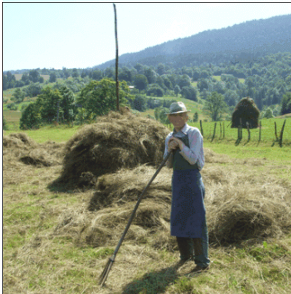
Fig. 6. Strângerea fânului

Fenomenul "desprinderii" meșteșugului de agricultură și creșterea animalelor s-a manifestat inițial prin specializarea unui număr restrâns de bărbați din fiecare sat. Și în cazul participării familiei la practicarea meșteșugului, unii membri ai acesteia (soția, copiii, bătrânii) continuau să se îndeletnicească cu agricultura, oricât de mică ar fi fost suprafața de teren arabil de care dispunea. Chiar și atunci când specializarea s-a extins asupra întregii comunități, aceeași locuitori continuau să practice vechile ocupații (agricultura, creșterea animalelor, negoțul cu produse din lemn, vase sau produse forestiere) (fig. 6).