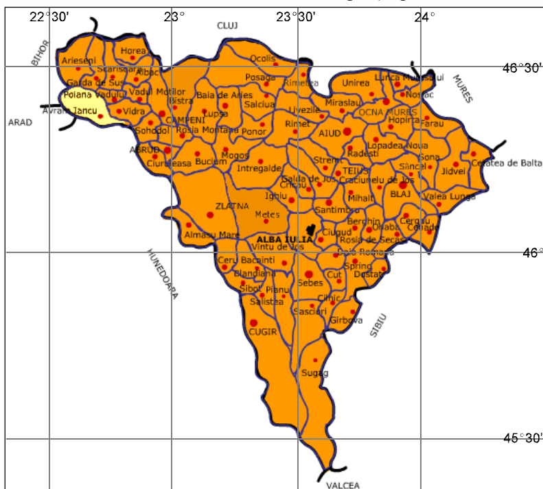
Fig. 1. Amplasarea comunei Avram Iancu în cadrul județului Alba

privința numărului de locuitori și întindere, distanța mare față de un oraș (fig. 2), duce de multe ori la apariția sărăciei (datorită numărului mic de locuri de muncă), la îmbătrânirea populației (tinerii dorind să locuiască la oraș), la marginalizarea ei și deci la apariția problemelor sociale.