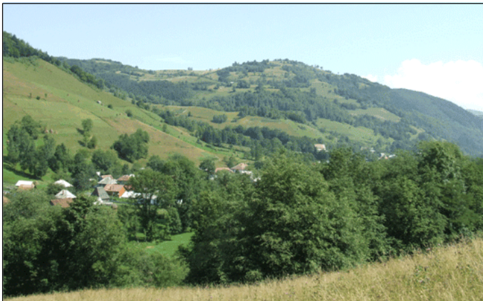
Fig. 3. Aspect din comuna Avram Iancu

Bulzeștii de Sus (jud. Hunedoara), comuna Hălmăgel (jud. Arad) și respectiv Crișciorul de Sus (jud. Bihor). Limitele cu aceste localități sunt și limitele județului Alba cu cele trei județe: Hunedoara, Arad și Bihor (fig. 1). Așezarea comunei Avram Iancu se poate raporta la câteva repere geografice: râul Arieș și Munții Bihorului. Poziția sa în bazinul superior al Arieșului Mic, la 19 km vest de confluența acestuia cu Arieșul Mare, într-o depresiune intramontană relativ largă, dezvoltată la confluența Arieșului Mic cu văile Vidrișoara și Dobrana, au făcut să devină una dintre cele mai însemnate localități montane, de care este strâns legată istoria românilor din Ardeal (fig. 3).