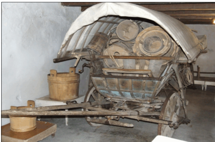
Fig. 5. Căruță moțească încărcată cu obiecte confecționate din lemn

Apariţia şi dezvoltarea unor ateliere meşteşugăreşti de confecţionare a vaselor din lemn (butoaie, ciubere, doniţe, putini, farfurii etc.), precum şi a altor obiecte de uz casnic sau artizanal, au fost determinate de insuficienţa producţiei agricole şi de abundenţa materialului lemnos. Meşteşugurile din lemn, în condiţiile izolării, au asigurat un venit mai mare decât lemnul cioplit sau fasonat. Vasele aveau trecere mai mare şi în schimbul lor se puteau obţine cereale. Pe de altă parte, produsele din se puteau transporta pe cai sau în căruţe (fig. 5), fiindcă drumurile de ţară s-au deschis mai târziu. Meşterii prelucrării lemnului cunoşteau aproape toate meşteşugurile din motive economice bine determinate.