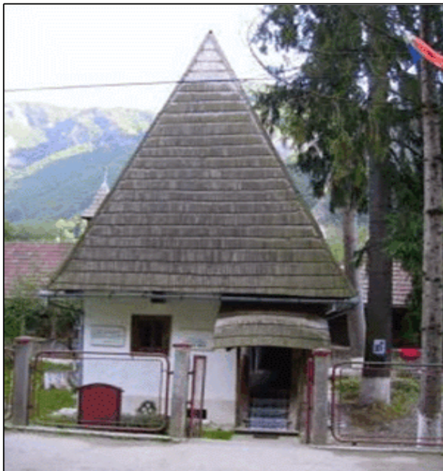
Fig. 7. Casa memorială Avram Iancu

Comuna Avram Iancu prin poziția sa geografică face parte din zona turistică a Munților Apuseni, una din cele trei ale județului Alba, poate cea mai importantă, și una din cele mai reprezentative ale țării, care beneficiază de un cadru natural deosebit de pitoresc, de un patrimoniu social-cultural-istoric deosebit de complex, dar insuficient valorificat prin dotările turistice.